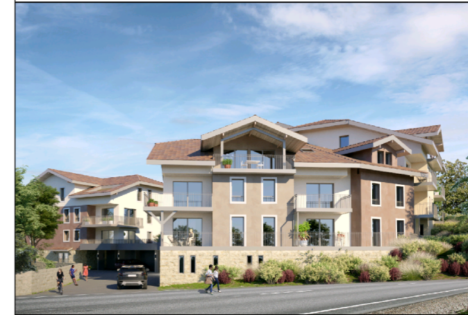
APPARTEMENT TYPE 5 N° A-204 au 2ème ETAGE