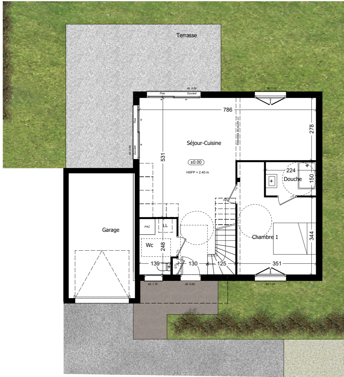
Rez de jardin