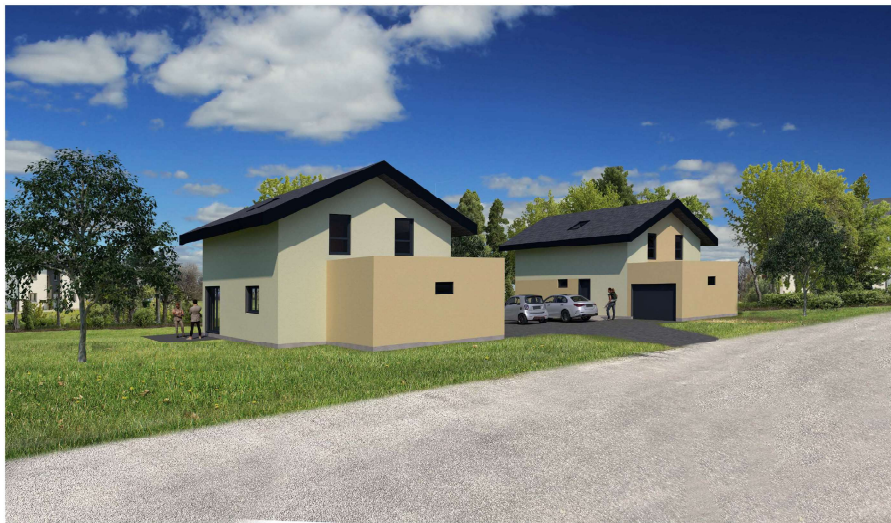
Commune de Vetraz-Monthoux LES VILLAS SEDNA