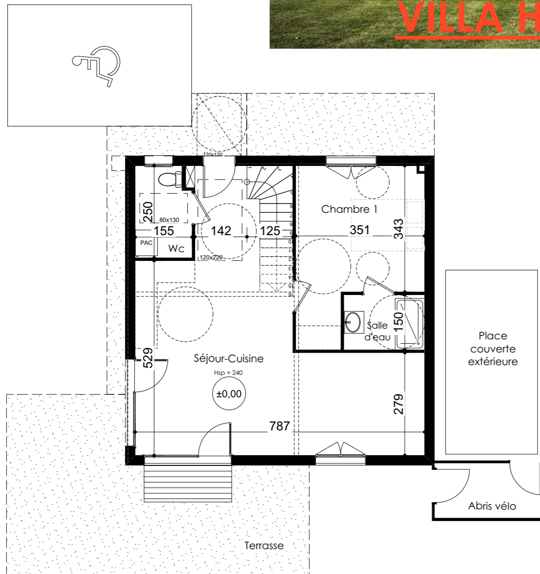
Rez de jardin