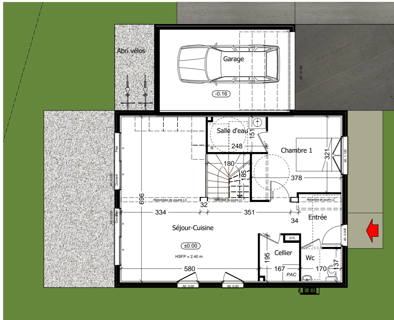
Rez de jardin