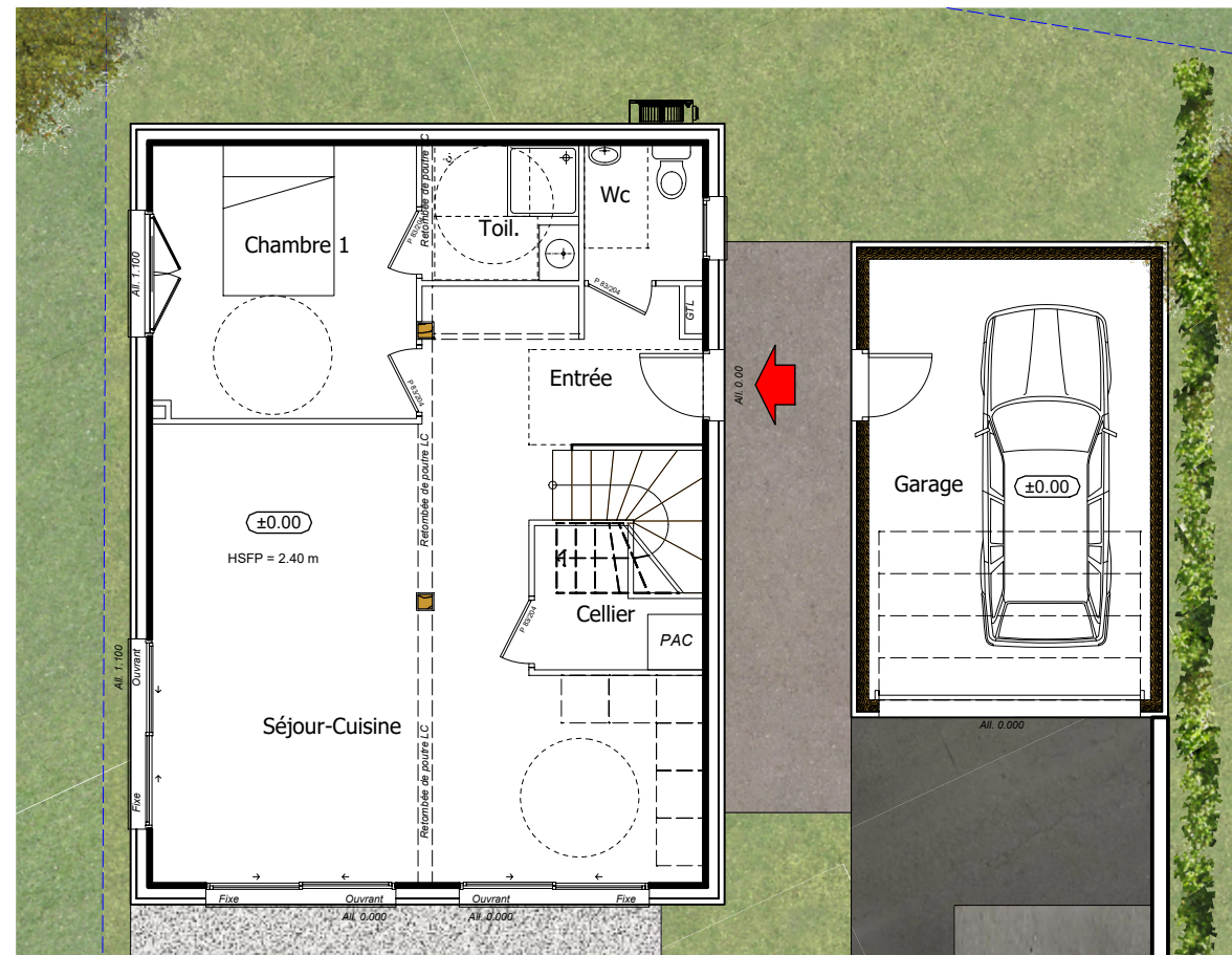
Rez de jardin