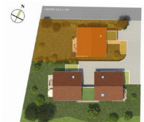
PLAN DE VENTE - le 19/11/2024