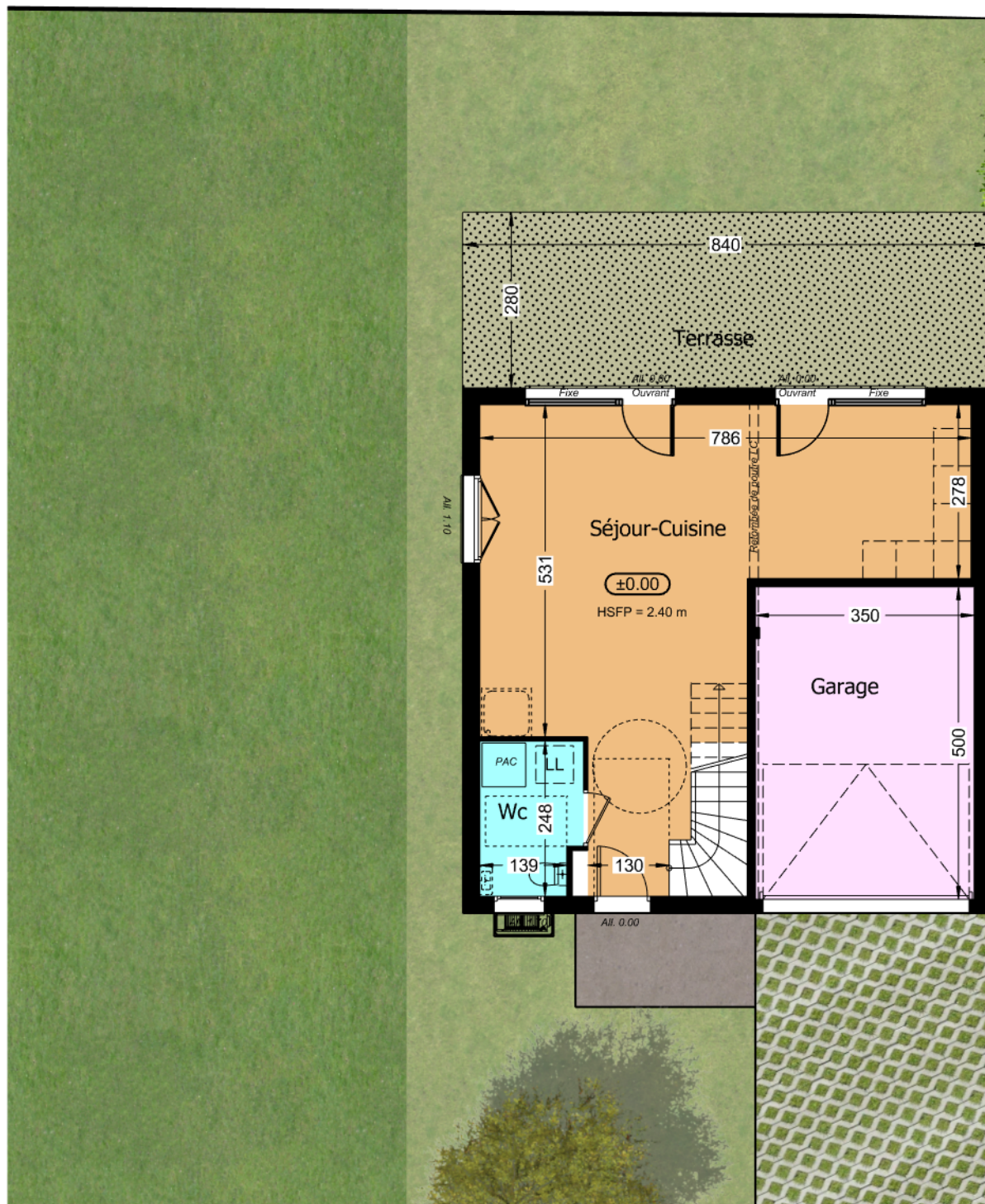
Rez de jardin