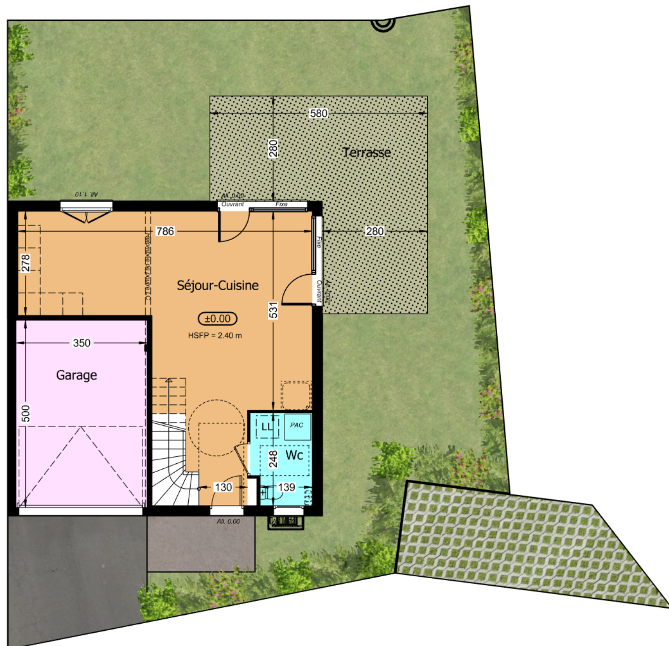
Rez de jardin