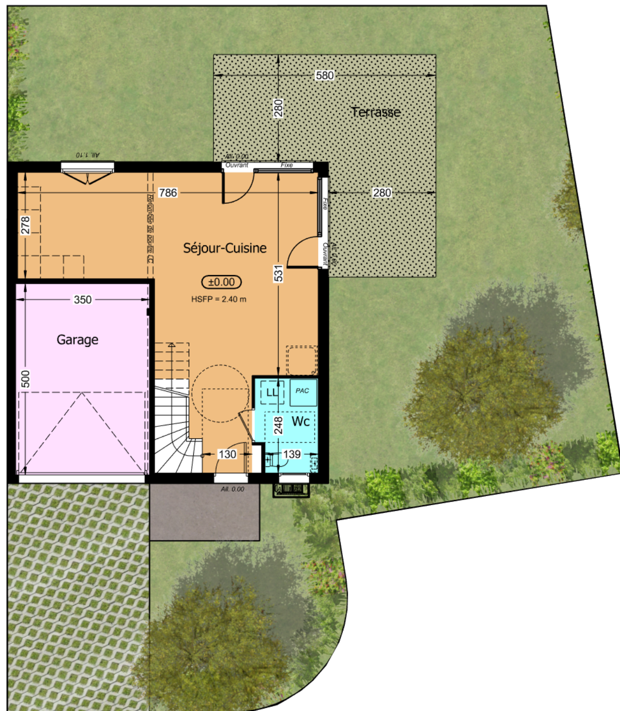
Rez de jardin