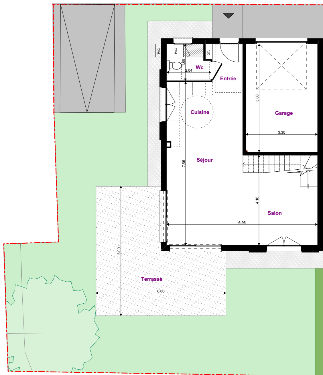
Rez de jardin