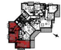
Plan d'Ensemble du Niveau

*Plan non contractuel, susceptible de modifications ou d'adaptations suivant impératifs techniques*