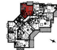
Plan d'Ensemble du Niveau

Plan non contractuel, susceptible de modifications ou d'adaptations suivant impératifs techniques.*