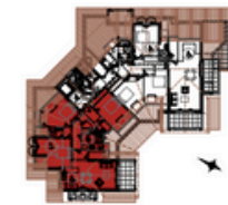
Plan d'Ensemble du Niveau

Plan non contractuel, susceptibles de modifications ou d'adaptations suivant impératifs techniques*